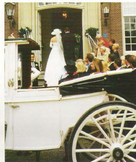
Wie fietst bij Sparrendaal, heeft grote kans op het spotten van bruidjes.